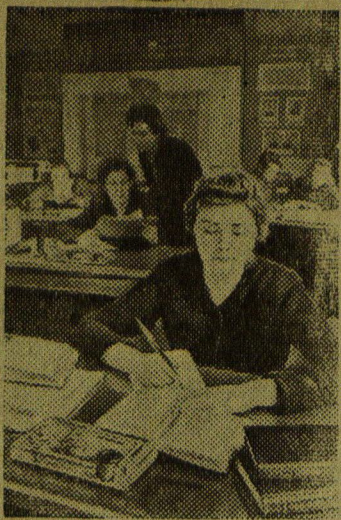
В партийном кабинете 1-го Московского часового завода.